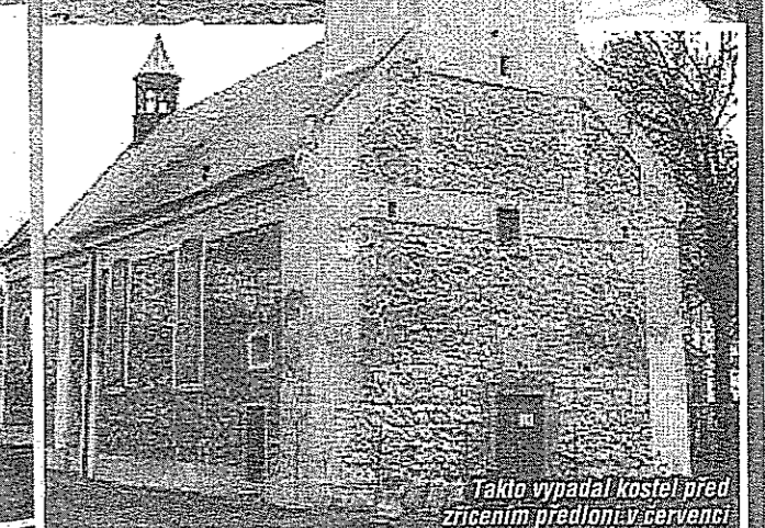
Takto vypadal kostel před zřícením předloň v červenci